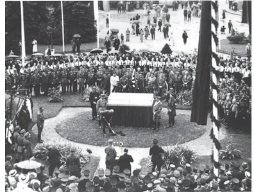
Gauleiter Sauckel und Hitler beim ersten Spatenstich zum späteren Gauforum, 4. Juli 1936

Eine umfassende Ausstellung zur Geschichte des Gesamtkomplexes ist im Anbau des unvollendeten Glockenturms zu besichtigen.