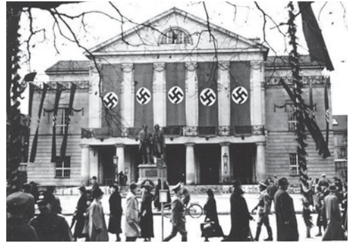
Das Deutsche Nationaltheater im Flaggenschmuck der Nationalsozialisten

Ende 1944 stellte das DNT den Spielbetrieb ein und wurde Rüstungsbetrieb. Bombenangriffe am 9. Februar 1945 zerstörten das Gebäude bis auf die Außenmauern. Die feierliche Wiedereröffnung mit einer Faust-Inszenierung fand am 28. August 1948 statt.