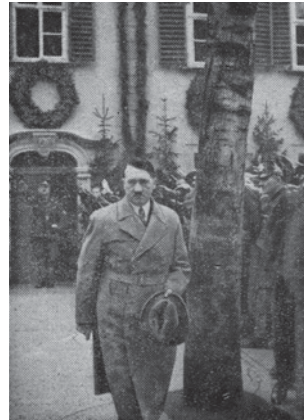
Hitler vor dem Schillerhaus, Nationalsozialistische Beamten-Zeitung, 25. November 1934

Weniger angenehm war dem Regime die Idee des Tyrannenmordes ( Wilhelm Tell ) und die Forderung nach Gedankenfreiheit ( Don Carlos ) – beide Dramen wurden 1941/44 verboten.