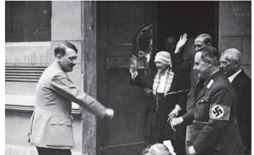
Elisabeth Förster-Nietzsche begrüßt Hitler im Eingang des Nietzsche-Archivs, 20. Juli 1934

Nach der Befreiung 1945 schloss das Archiv zwangsweise seine Pforten und wurde nie wieder eröffnet. Die Archivbestände kamen ins Goethe- und Schiller-Archiv. Das Gebäude ist heute Sitz des Kollegs Friedrich Nietzsche.