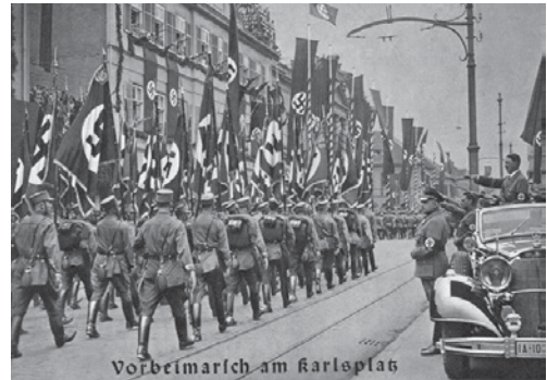
NS-Parade auf dem ehemaligen Karlsplatz, 6. November 1938

Die größten politischen Feierlichkeiten fanden hier vom 4. bis 6. November 1938 anlässlich des 10. Gautages Thüringen statt. Dazu hatte man das Reiterstandbild Großherzog Carl Alexanders (1907), von dem heute wieder der beschädigte Sockel zu sehen ist, eigens entfernt und auf den heutigen Buchenwaldplatz versetzt (siehe Station 1), um Platz für die Ehrentribüne des »Führers« zu schaffen.