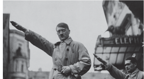
Hitler und sein Stellvertreter Rudolf Heß nehmen eine Parade ab, 12. Oktober 1930

Hitlers private Suite lag zur stillen Gartenseite hin. Nach der glanzvollen Einweihung im November 1938 aber wurde diese nur wenig genutzt, denn allzu oft kam der »Führer« nicht mehr in seine »Pfalz«. Die fotografisch dokumentierten Huldigungen tausender Weimarer Bürger (» Lieber Führer komm heraus aus dem Elephantenhaus «) und zahlreicher NS-Formationen fanden daher wohl überwiegend vor dem Umbau des Hotels statt.