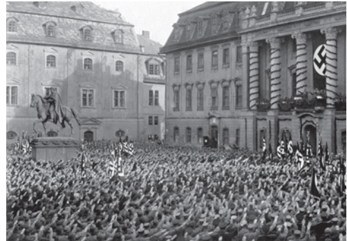
Die Bibliothek als Kulisse: Gautag des Beamtenbundes, 24. September 1933