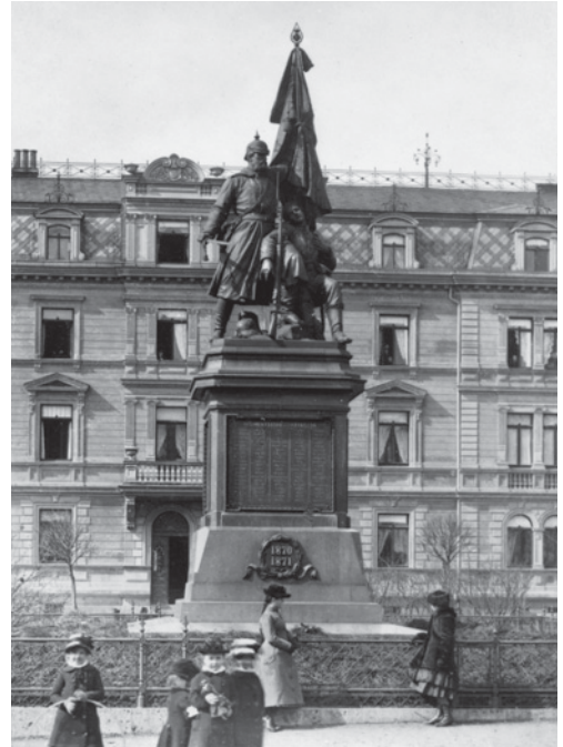
Denkmal für den Krieg 1870/71 auf dem damaligen Watzdorf-Platz, um 1900

Die Lage des Platzes im Stadtbild Weimars erinnert an den im Goethejahr 1949 geprägten Satz des Germanisten Richard Alewyn: » Zwischen uns und Weimar liegt Buchenwald, darum kommen wir nun einmal nicht herum. «