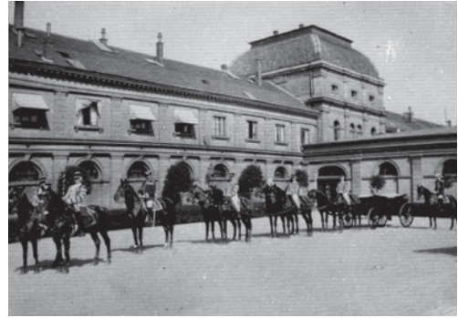
Galazug des Großherzogs Wilhelm Ernst, um 1915

Das Hauptstaatsarchiv (modernisiert 1995/2004) nutzt seine Bestände regelmäßig für thematische Sonderausstellungen und ist damit ein aktiver Teil des kulturellen Gedächtnisses in Weimar und Thüringen.