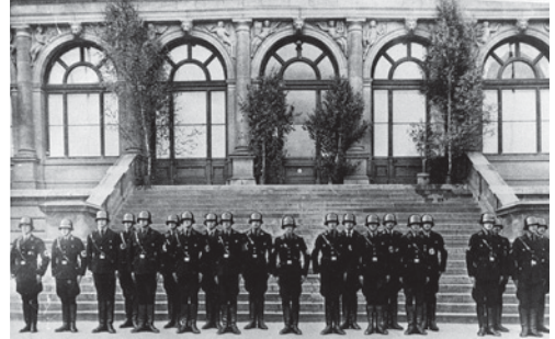
SS-Stabswache vor dem als Reichsstatthalterei genutzten Landesmuseum, 1934

Diese Ereignisse um Fricks berüchtigten Erlass Wider die Negerkultur für deutsches Volkstum waren Vorschein späterer Attacken gegen die moderne Kunst. Vom 23. März bis 24. April 1939 zeigte man im Landesmuseum die 1937 für München konzipierte Ausstellung Entartete Kunst . Kombiniert war diese »Schreckensschau« mit der Wanderausstellung Entartete Musik , die Weimars einflussreichster NS-Kulturfunktionär, Hans Severus Ziegler, schon 1938 für die Düsseldorfer Reichsmusiktage gestaltet hatte.