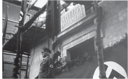
Der Architekt Paul Schultze-Naumburg bei der Weihe der Nietzsche-Gedächtnishalle, 30. Oktober 1937

Kurzzeitig als Sitz des Sowjetischen Geheimdienstes genutzt, diente der im Inneren um- und ausgebaute Komplex ab 1946 als Rundfunkstudio. Inzwischen in privater Hand steht das Gebäude seit nunmehr zehn Jahren leer.